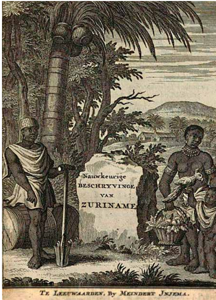
Nauwkeurige beschryvinge van Suriname , uitgegeven in 1718 door de Leeuwarder uitgever en boekverkoper Meindert Injema, beschrijft koffie als een van de producten die daar vandaan worden betrokken.