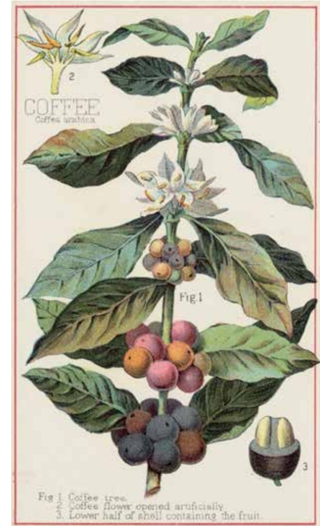
Amerikaanse botanische prent van de koffieplant, ofwel de Coffea Arabica, uit de periode 1870-1900.

Hoe verliep in grote lijnen die distributie en het gebruik van koffie in Fryslân? Koffiebonen werden per schip vanuit de koloniën naar Nederland vervoerd, waar ze via havens zoals die van Amsterdam en Rotterdam hun weg vonden naar Fryslân. Steden als Harlingen en Sneek waren belangrijke knooppunten voor de handel in koffie en andere koloniale waren. Handelaren en winkeliers verzorgden de distributie.