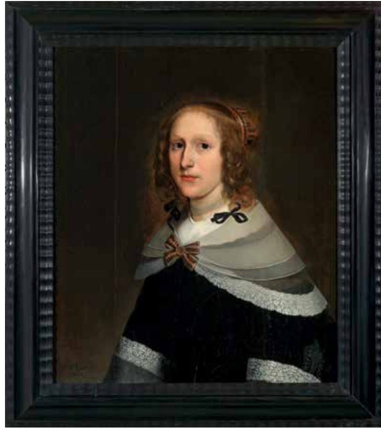
< Ongerestaureerde staat van Wybrand de Geest, Portret van een vrouw , gesigneerd en gedateerd 1651, olieverf op paneel, 71,5 x 60 cm. [Fries Museum | Collectie Koninklijk Fries Genootschap]