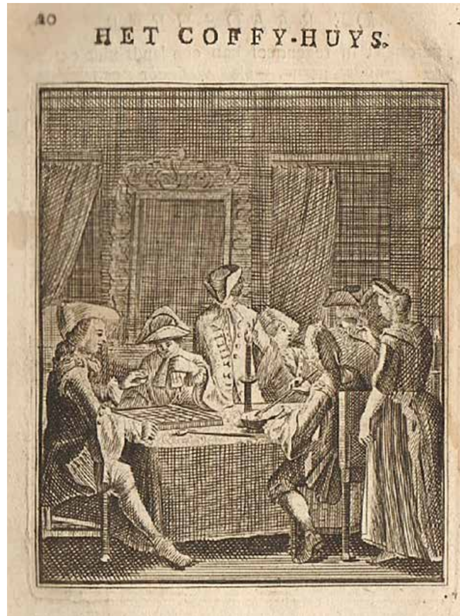
Tekening van een 'coffy-huys' in de achttiende eeuw. (HMBO Goes)

Het genotmiddel koffie werd aanvankelijk vooral gedronken door de hogere klasse. Het luxeproduct kan in de tweede helft van de achttiende en de eerste helft van de negentiende eeuw gezien worden als een graadmeter voor welvaart en verandering. Het gemiddelde inkomen in Fryslân was het hoogste in geheel Nederland, lag het koffiegebruik dan ook daadwerkelijk hoger dan elders in het land?