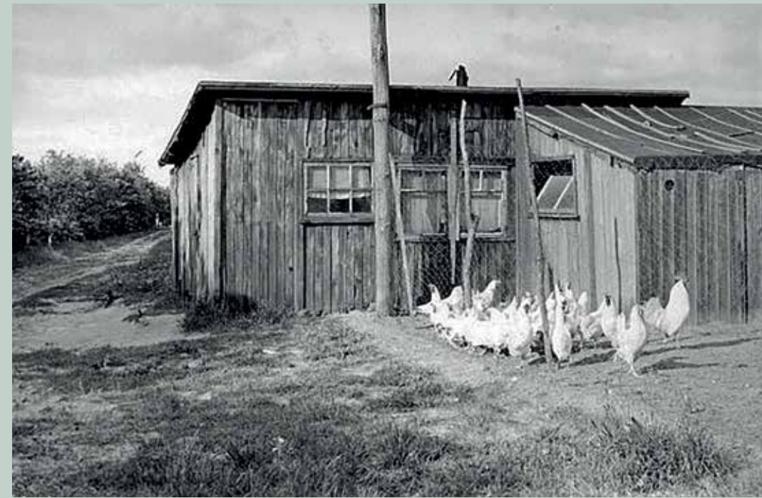
Een kippenhok als woning in Harkema, jaren '50. [Fokke Ophuis]