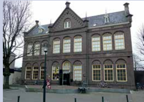
Museum Opsterlân in Gorredijk.

De ontvangst op donderdag 2 oktober is om 13.30 uur in Museum Opsterlân, Hoofdstraat 59, 8401 BW Gorredijk. In de omgeving van het museum is parkeren gratis met gebruik van de blauwe schijf (max. 3 uur). De begraafplaats ligt op drie kilometer afstand van het museum. Parkeren kan in de berm van de Dwersfeart. Aan leden die in het bezit zijn van een Museumkaart, het verzoek om deze mee te nemen.