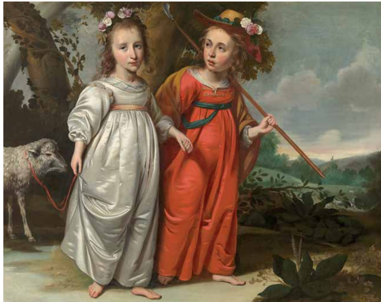
Gerestaureerde staat, met schaap.

De geportretteerde draagt een borstkuras, een sjerp, een liggende kraag en modieus lang haar. Het schilderij is geschilderd op paneel, zoals gewoonlijk opgebouwd uit drie verticale, aan elkaar verlijmd planken. Zo'n vijftig jaar geleden werd het werk al eens gerestaureerd. Sindsdien zijn de oude retouches verkleurd en is de vernis sterk vergeeld. Bovendien zijn de panelen door herhaald verlijmen verschoven, wat tot schade leidde. Nadat de recente restaurator het schilderij terugbracht naar de stripped state , kwamen opvallende details aan het licht: krasvormige beschadigingen die doen denken aan de inslag van een degen – mogelijk het gevolg van scherppartijen – en een gat in het midden aan de bovenkant, ooit gebruikt om het werk zonder lijst op te hangen. Dergelijke sporen bleken niet uniek. Een ander portret, dit keer van een onbekende officier, vertoont vergelijkbare degenkrassen én een gat op dezelfde plaats. Vermoedelijk hingen beide schilderijen ooit in dezelfde ruimte, maar het is onduidelijk wanneer dat precies was. Dok staat niet vast of het tweede portret door De Geest is geschilderd. Zeker is wel dat beide werken eind negentiende eeuw aan het Fries Genootschap werden geschonken door de familie van Hobbe Baerdts van Sminia. Hij bezat een verzameling oude portretten, deels afkomstig uit de inventarissen van afgebroken states. Zijn de degenkrassen bij hem thuis ontstaan?