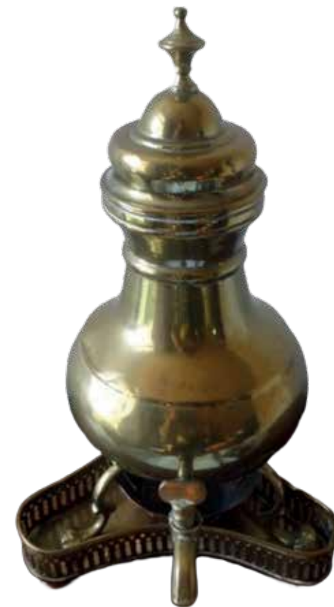
Koffieketel uit het eind van de achttiende eeuw.

Daarna veranderde de koffiecultuur op het Friese platteland. Aan het einde van de negentiende eeuw heerste er in grote delen bittere armoede en was koffie voor sommige Friese boeren en veel arbeiders te duur. Hierdoor groeide de behoefte aan een goedkoper alternatief: cichorei. Cichorei is een plant waarvan de wortels geroosterd en gemalen werden om een koffieachtige drank te maken. Het werd al snel populair onder de armere delen van de bevolking. Het bood een acceptabele smaak en was aanzienlijk goedkoper dan geïmporteerde koffiebonen. In de twintigste eeuw begonnen grenzen tussen boeren en knechten te vervagen dankzij het doorbreken van democratische waarden en sociale gelijkheid. Koffie bleef een belangrijk onderdeel van het dagelijkse ritme en werd steeds meer de universele drank voor iedereen op de boerderij, ongeacht sociale status.