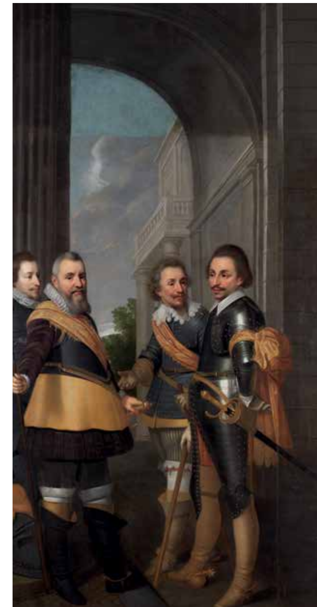
Gerestaureerde staat maar nog niet ontdaan van later toegevoegde stukken. Wybrand de Geest (ongesigneerd), Groepsportret van vier kleinzonen van Jan de Oude van Nassau-Dillenburg: Albert van Nassau-Dillenburg, en de broers Johan Ernst, Adolf en Jan de Jongere van Nassau-Siegen, 1628-1633, olieverf op doek, 234 x 135 cm. [Fries Museum | Collectie Koninklijk Fries Genootschap | Schenking Koning Willem III].

Aanvankelijk leek het schilderij alleen een lichte opknappbeurt nodig te hebben. Toch bleven enkele vreemde, donkere plekken op het doek vragen oproepen. Uiteindelijk is besloten het werk toch grondig schoon te maken. Tijdens het terugbrengen naar de zogenaamde stripped state – waarbij alle latere overschilderingen worden verwijderd – ontdekte de restaurator bij een vinger van het linker kind een vreemd rood vlekje. Na voorzichtig verder werken, kwam een rood lintje tevoorschijn en uiteindelijk zelfs een ruwharig schaap, half afgesneden van het doek.